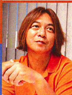
総合探偵社 日本調査情報センター

浮気に対し男は鈍感だが女は敏感。妻が探偵事務所に浮気調査を依頼してくる場合、その疑惑はほぼ100%の確率であたっている。思い込みや勘違いということはまずありえない。浮気はばれること前提で。